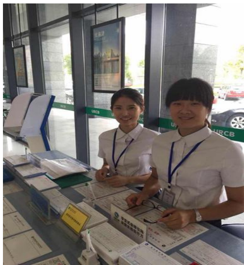
图 4: 学徒开展岗前培训

学徒在正式入职之前，统一安排岗前集中培训，主要以新员工理论知识学习为主，深化银行基本礼仪、信贷基础知识、银行产品营销、银行业务操作等专业知识。辅以实战辅导，为每一位学徒配备一名信贷经验丰富的师傅，带领开展市场营销，学校为每位学徒配备校内指导老师，采用“1+2”管理模式，学校与银行对学员展开多元评价及考核。