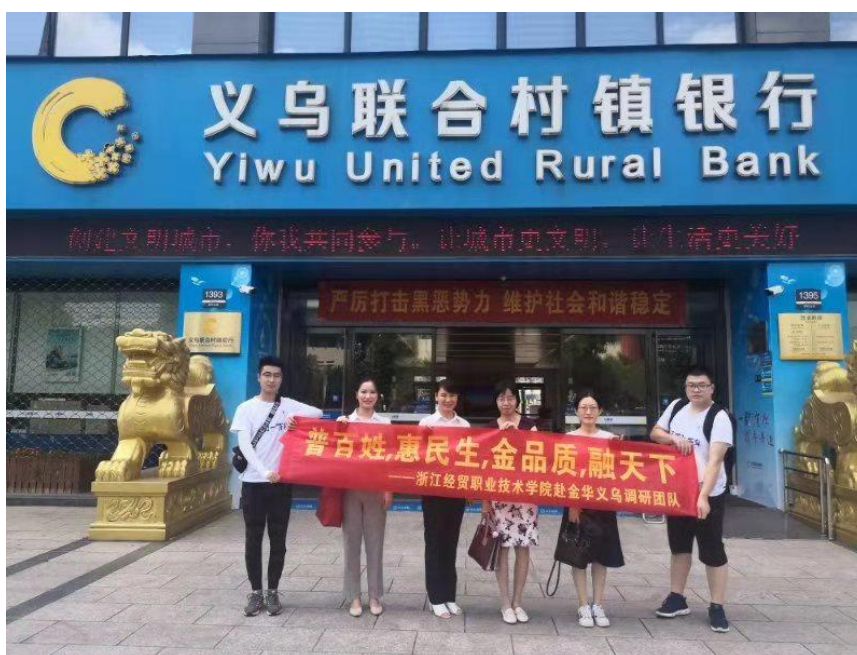
图 8: 2019 年学校师资团队为义乌联合村镇银行开展暑期咨询服务

整合校双方优势教学资源,从杭州联合银行选聘用具有资深从业经验的讲师和业务经理,从校内专任师资队伍中选拔科研能力强、技术水平高的优秀师资,共建一支结构多元、专兼结合、专业突出的服务型现代学徒制师资团队。银行为学生提供课程培训、校外实训指导,学校教师团队为银行展开风控咨询、普惠金融业务咨询服务等技术服务。