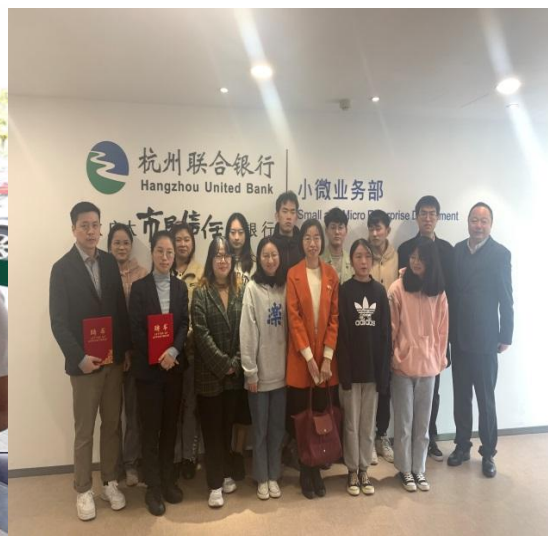
图 5: 学徒授课结业