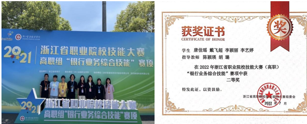
图 9：学生参加浙江省银行技能成绩喜人