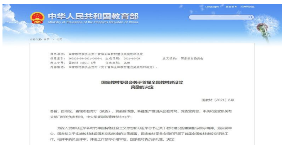
图 7: 校企共编教材《金融产品营销实务(第四版)》获全国首届教材建设二等奖