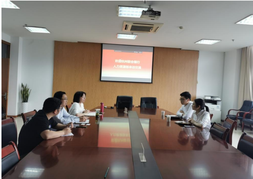
图 2: 校企双方探讨学徒制模式